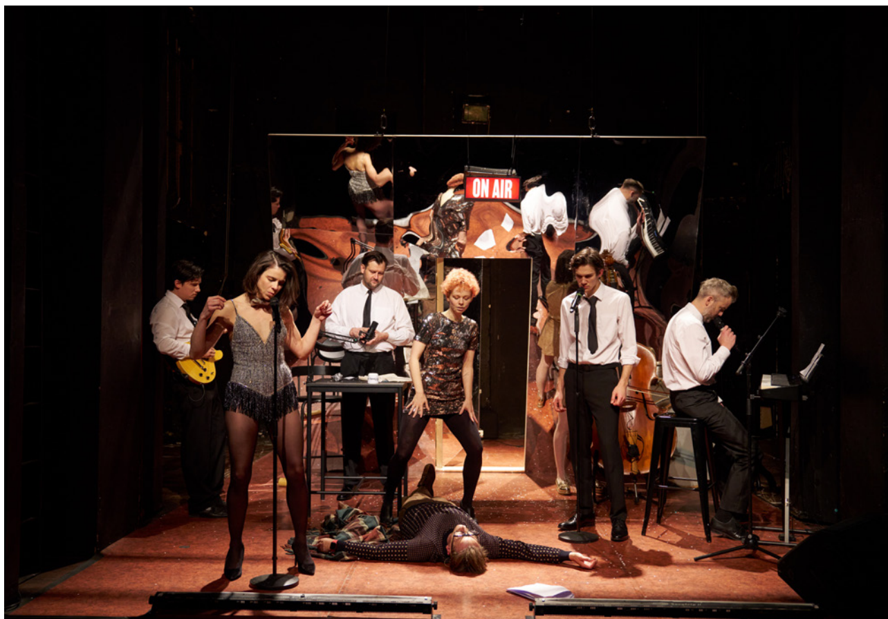
Závěrečná scéna inscenace

Svérázný rozhlasový moderátor sice žije pro své povolání, ale v současném světě už nenachází své místo. Ve studiu se střídají vzácní hosté a úvahy o dnešní společnosti i střetu generací se prolínají s písňovými vstupy v podání živé kapely. Půlnoc se blíží a vysílání by mělo skončit. Ale kdo tvrdohlavého hlasatele donutí opustit studio, ve kterém strávil desítky let svého života?